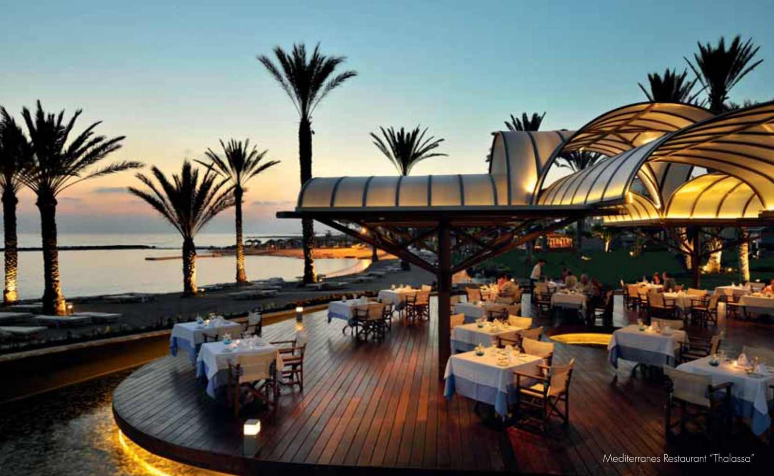
Mediterranes Restaurant "Thalassa"