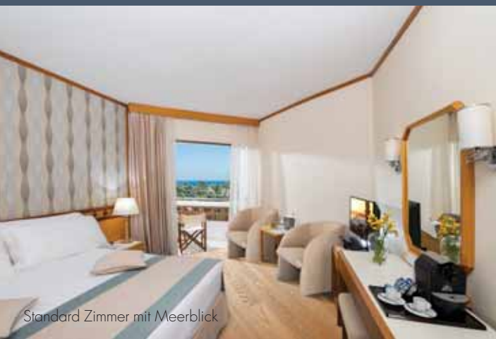
Standard Zimmer mit Meerblick

Herrliche Ausblicke auf das Meer, Eleganz und die Liebe zum Detail bieten höchstes Urlaubsvergnügen!