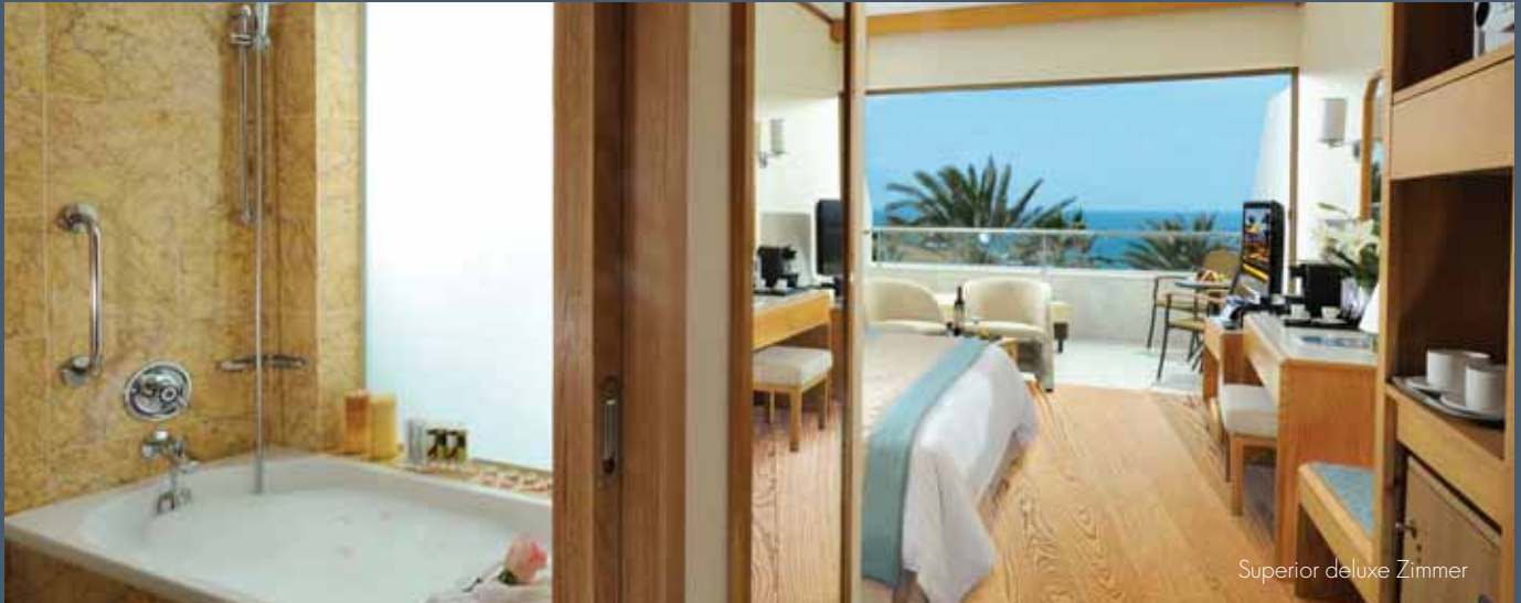
Superior deluxe Zimmer

Entdecken Sie eine unübertroffene Servicequalität - ein 5-Sterne-Erlebnis in unseren 4-Sterne-Hotels, die Ihnen zur Verfügung steht, wenn Sie eine Unterkunft in den Kategorien Superior, Superior Deluxe oder Suite buchen.